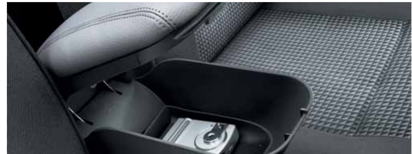
ПОДГОЛОВНИКИ • ЧЕХЛЫ СИДЕНИЙ • КОВРИКИ САЛОНА • ПОДДОНЫ В БАГАЖНИК • СЕТКИ • ВЕШАЛКА