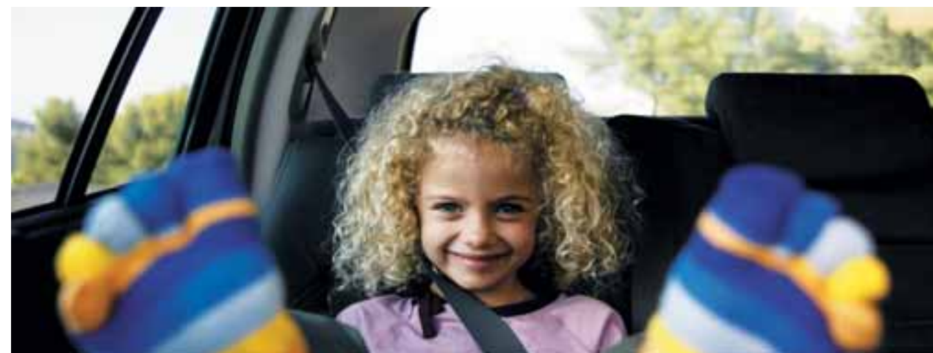
ДЕТСКИЕ КРЕСЛА • СИГНАЛИЗАЦИЯ • ПАРКОВОЧНЫЙ РАДАР • НАБОР АВТОМОБИЛИСТА